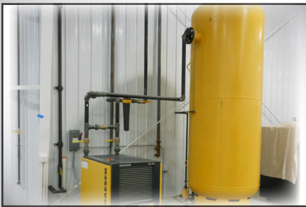
Simplemente conecte el CA al aire existente de la planta o a un compresor centralizado.