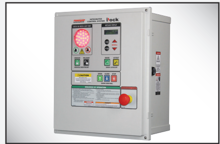
iDock Controls mejorados opcionales con pantalla de mensajes interactiva y que se pueden integrar con cualquier otro equipo de andén.