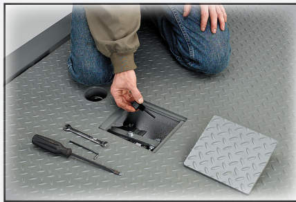
Placa de inspección de mantenimiento en la plataforma para permitir el mantenimiento sobre el muelle/andén.