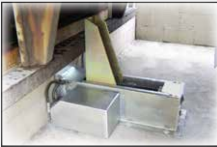
PowerHold® se puede montar en la superficie de conducción o en pared.