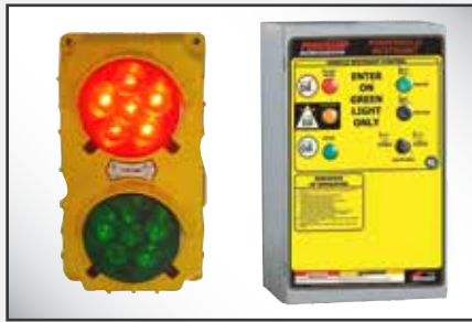
Los controles se combinan fácilmente con los controles del nivelador de muelle/andén para integrar todo el sistema de muelle/andén.