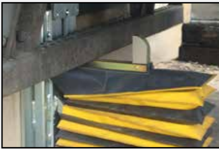
El motor y la bomba autónomos de Stop-Tite® se pueden montar de manera remota.