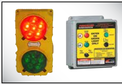
Los controles se combinan fácilmente con los controles del nivelador de muelle/andén para integrar todo el sistema de muelle/andén.