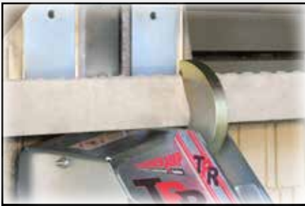
El gancho TPR® gira para enganchar la protección RIG y fija el remolque al muelle/andén de carga.