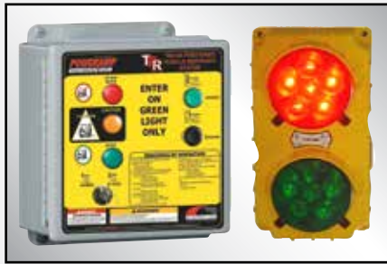
El sistema de control incluye comunicación por luces y se puede integrar con cualquier otro equipo de muelle/andén.