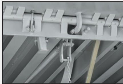
La extensión positiva de reborde Lip Drive extiende el reborde del nivelador de manera confiable y restringe su descenso hasta que realice la bajada.