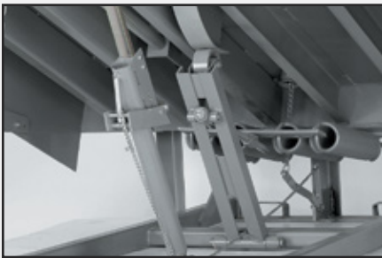
El conjunto equilibrador Cam Control permite que la rampa se extienda suavemente y que el nivelador baje fácilmente.