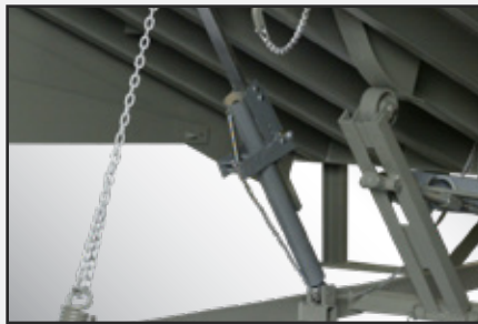
Mecanismo de sujeción del tambor de oscilación, margen extendido y para servicio pesado.