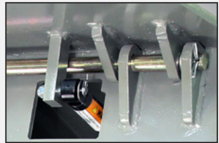
Plataforma de "construcción de caja" con un diseño de bisagra tipo orejeta para servicio pesado.