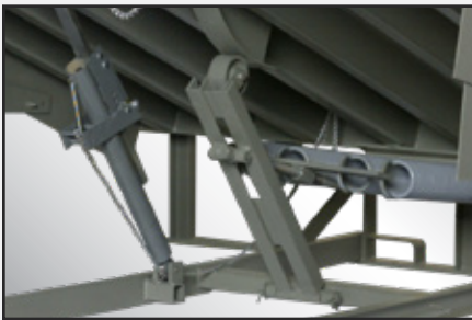
El conjunto equilibrador Cam Control permite que la rampa se extienda suavemente y que el nivelador baje fácilmente.