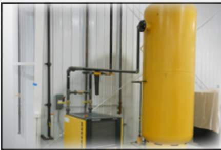
Simplemente conecte el CA al aire existente de la planta o a un compresor centralizado.