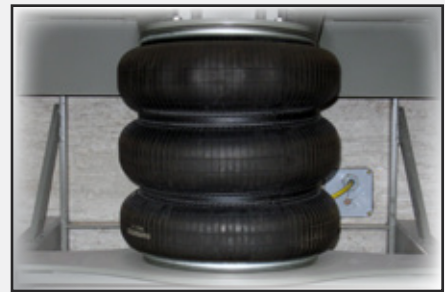
El sistema de fuelle de hule con correa de acero utiliza aire comprimido para elevar la plataforma.