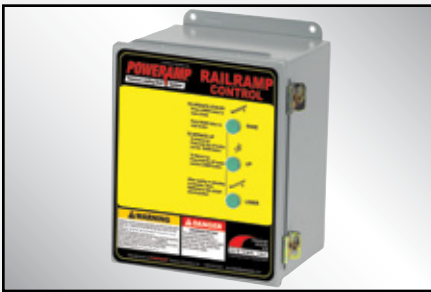
Los botones de presión constante de elevación, bajada y reborde proporcionan un control continuo al operador.