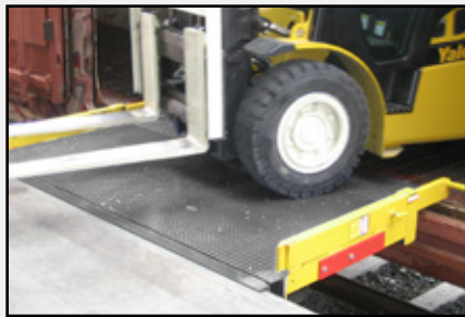
Protecciones contra descarrilamiento amarillas estándar para evitar que un montacargas salga del borde.