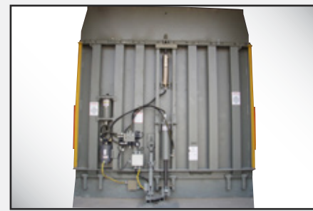
Margen extendido de servicio con estructura de viga amplia/de bajo perfil de Poweramp.

El nivelador hidráulico de almacenamiento vertical serie VS de Poweramp ofrece un control ambiental sin comparación para aplicaciones sensibles a la temperatura. Diseñado con el nivel más alto de resistencia y seguridad, el modelo VS se convierte en una excelente opción para cualquier operación avanzada de muelle/andén de carga.