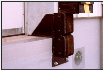
Parachoques laminados verticales con soporte con escuadra y placa de distribución de carga.