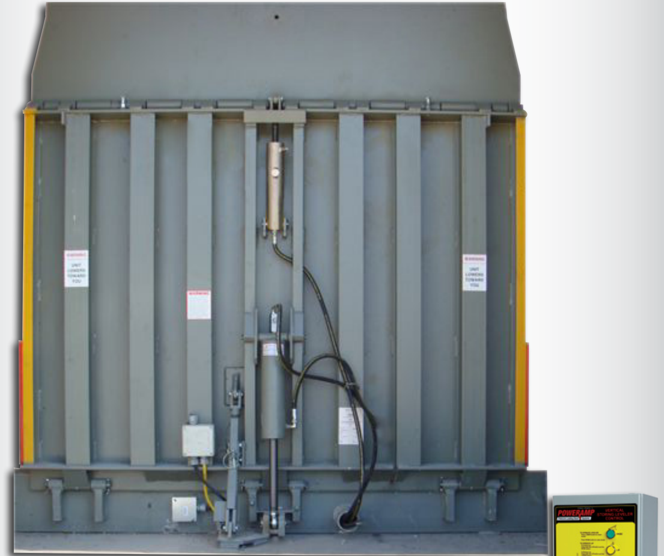
* Se muestra la serie VS de 7' x 6' (2.1 m x 1.8 m) y clasificación CIR de 22,679 kg (50,000 lb) con solenoides y motor remotos