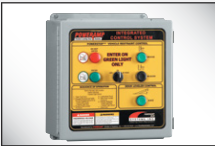
Panel de control del sistema de comunicación del muelle/andén para luces automáticas; el panel de control manual de luces es similar.