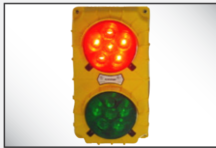
Luces exteriores: incandescentes de manera estándar, con LED opcional para una vida útil prolongada.